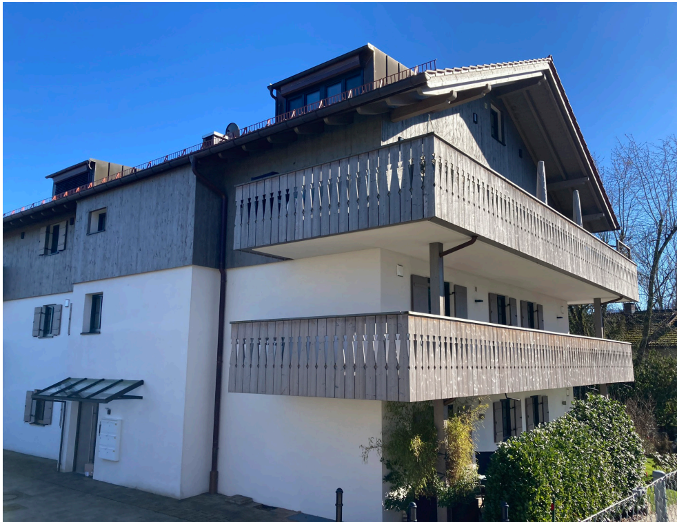
West - und Nordfassade