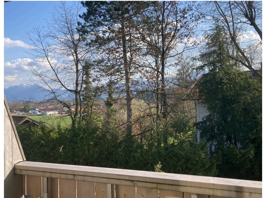
Blick nach Süden