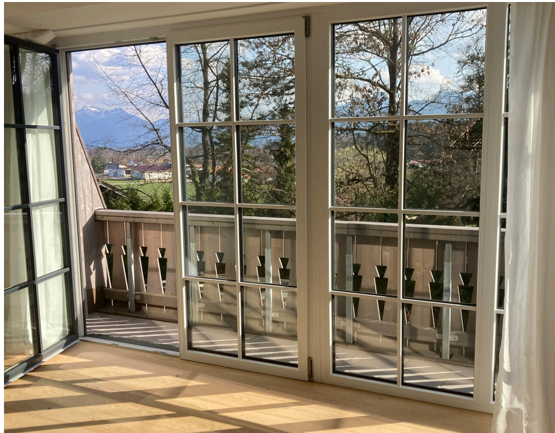
Blick nach Süden